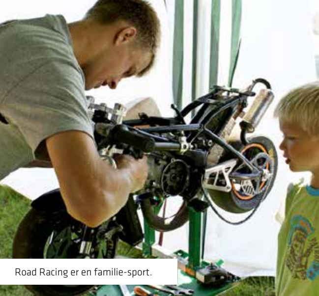
Road Racing er en familie-sport.