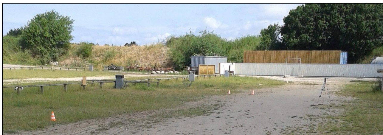
Fig 2 Måleopstillingen